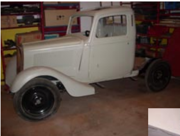
A lato e sotto: la Balilla in corso di restauro

Il restauro della Balilla Camioncino anche se a rilento sta andando comunque avanti. Come abbiamo detto nel precedente numero del gazzettino, il lavoro più importante, ovvero il recupero e la sistemazione della carrozzeria è stato terminato. La meccanica è stata completamente rifatta, adesso il camioncino è in carrozzeria, subito dopo completeremo la parte meccanica, l'impianto elettrico e la tappezzeria e poi si spera di metterla in movimento. Sarebbe bello poter terminare il restauro entro la fine dell'anno, ci proveremo ma non sarà facile. Intanto da rimarcare il successo che ha avuto la sottoscrizione fatta tra i soci ad inizio anno, proprio per sostenere il restauro. Un grazie a tutti coloro che hanno aderito a questa sottoscrizione.