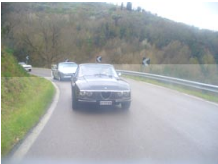
Auto al raduno dello Scricchio