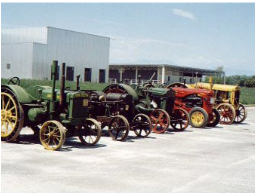
Trattore John Deere d'epoca