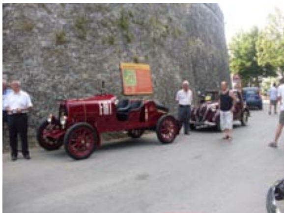
Bolidi a Radda in Chianti