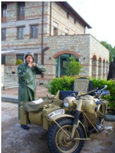
Motocicletta "in tedesco"

Si ricorda a tutti gli appassionati e collezionisti di moto d'epoca, che il Certificato di Iscrizione, meglio conosciuto come Omologazione o Targa Oro è un valore aggiunto che si dà al veicolo, non solo economico ma soprattutto collezionistico.