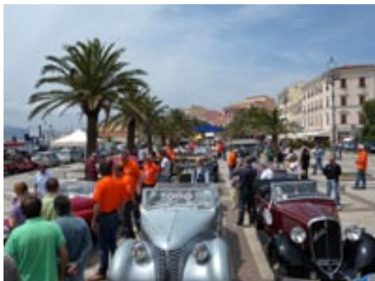
Scame al Sardinia Vuitton Classic

Per informazioni te. 337706513 – 3482655434