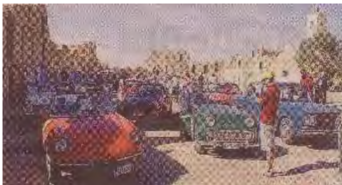
I partecipanti al raid Roma-Cartagine